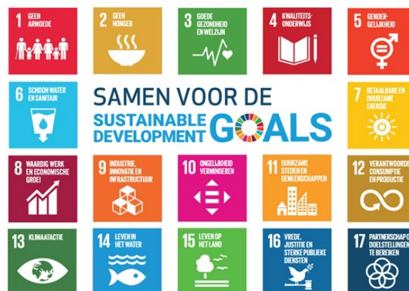
Figuur 3: Sustainable Development Goals van de Verenigde Naties

De Duurzame Ontwikkelingsdoelen (SDG's), officieel bekend als de '2030 Agenda voor Duurzame Ontwikkeling', zijn een reeks van 17 globale doelen die zijn opgesteld door de Verenigde Naties. Ze zijn in 2015 aangenomen door alle 193 lidstaten van de VN en hebben als doel om een einde te maken aan armoede, de planeet te beschermen, en ervoor te zorgen dat alle mensen vrede en welvaart kunnen genieten. Deze doelen zijn bedoeld om in 2030 bereikt te zijn. Elk van de 17 doelen heeft specifieke targets (169 in totaal) die concrete stappen en acties beschrijven om de doelen te bereiken. Ze omvatten een breed scala aan sociaaleconomische en milieuaspecten. De doelen roepen op tot onderwijs, gezondheidszorg en fatsoenlijke banen voor iedereen, en bescherming van de oceanen, bossen en volledig natuurlijke habitats. Ze schetsen een beeld van een toekomst waarin vooruitgang iedereen ten goede komt, waar klimaatverandering een halt wordt toegeroepen en alle mensen in vrede en welvaart kunnen leven. Het unieke karakter van de SDG's betekent dat ze met elkaar verbonden zijn – vooruitgang boeken op het ene doel leidt vaak tot vooruitgang op een ander doel, of soms zelfs op meerdere.