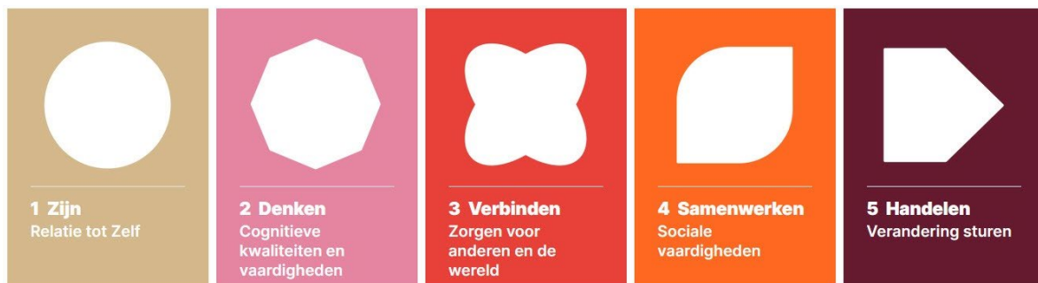
Figuur 5: Inner Development Goals 1

waarin zowel werknemers als werkgevers kunnen floreren. De Sustainable Development Goals van de Verenigde Naties en de daarvan afgeleide Inner Development Goals (IDG's), dienen als kompas voor de juiste richting.