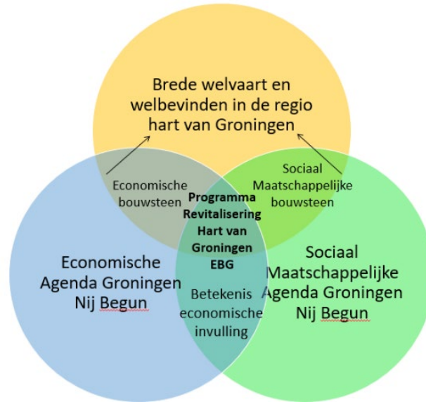
Figuur 4: Nij Begun, een start naar een Groningse betekenis-economie

In dit licht ziet Economic Board Groningen dit programmavoorstel als een brug tussen twee domeinen die conceptueel gescheiden zijn, maar in de praktijk elkaar kunnen versterken. Het ambieert een nieuwe aanpak waarbij sociale vraagstukken worden